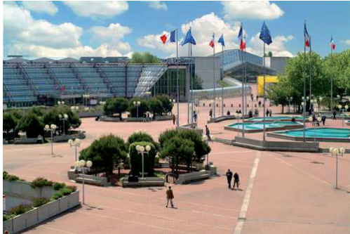
Messegelände Paris Nord Villepinte

REED EXPO ist der größte Messeveranstalter der Welt. In 34 Ländern veranstaltet REED jedes Jahr 460 Messen mit über 6 Millionen Ausstellern und Besuchern. Die POLLUTEC belegt auf dem Messegelände Paris Nord Villepinte eine Fläche von ca. 50.000 qm. Das Messegelände befindet sich in der Nähe des internationalen Flughafens Roissy Charles de Gaulle und des ICE-Bahnhofs von Le Bourget.